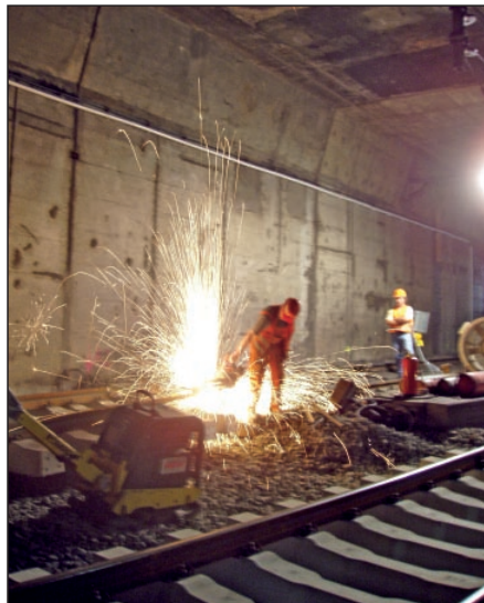
Abb. 5: Trennen der Schienen

Aufgrund der genauen Planung, der Vorarbeiten und der Schaffung der richtigen optimalen Randbedingungen durch Lüftung und Logistik war es den Mitarbeitern der DB Netz Instandsetzung überhaupt erst möglich, eine solch anspruchsvolle Maßnahme in so kurzer Zeit umzusetzen. Um den Personalbedarf der Großbaustelle decken zu können, wurden die Mitarbeiter der Instandsetzung aus Frankfurt von Kollegen des Stützpunktes Bebra unterstützt.