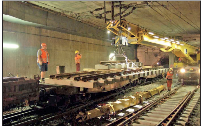
Abb. 4: Abladen der Weichensegmente im Tunnel