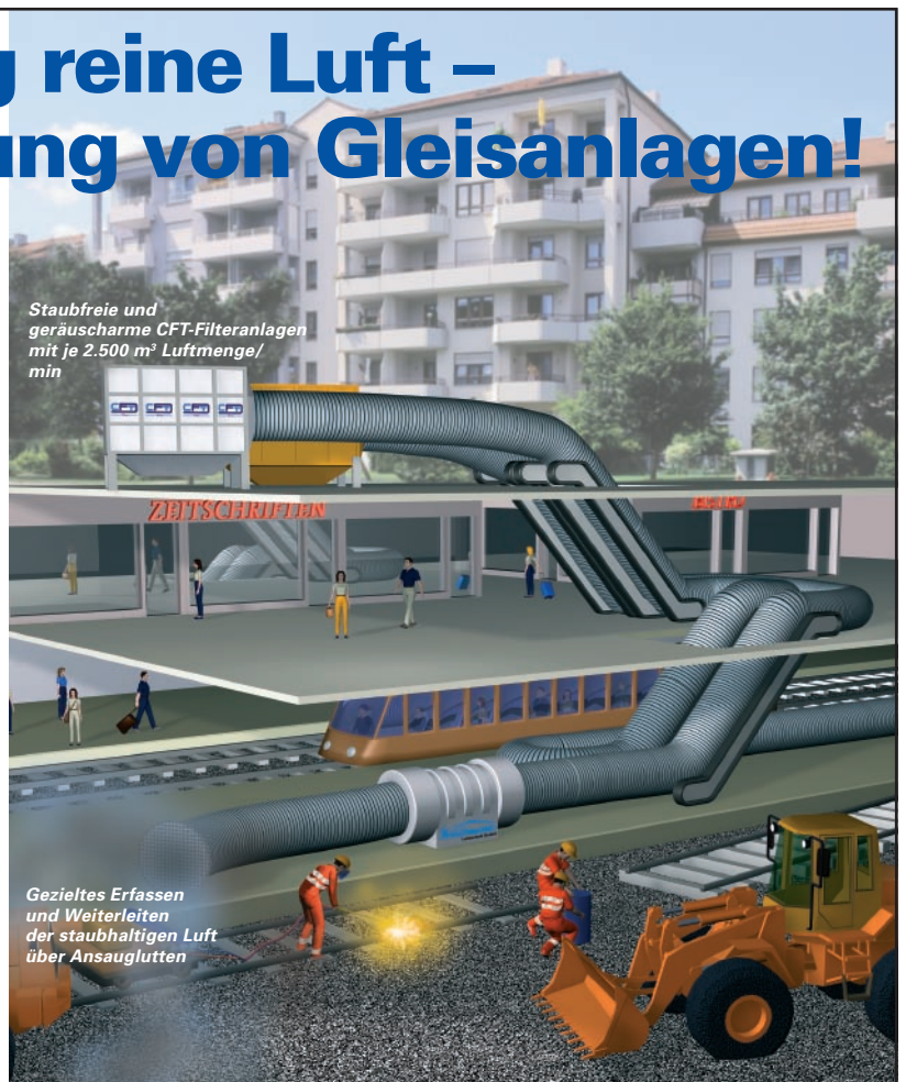
Staubfreie und geräuscharme CFT-Filteranlagen mit je 2.500 m 3 Luftmenge/min

Die gefilterte Abluft ist reiner als die Umgebungsluft – mit mühelos erzielten Abscheidungsgraden von nahezu 100%. Die Bauweise der Anlagen erlaubt kompakte sowie flexible Baugrößen und variable Leistungsauslegungen von 30 bis 3.000 m 3 /min.