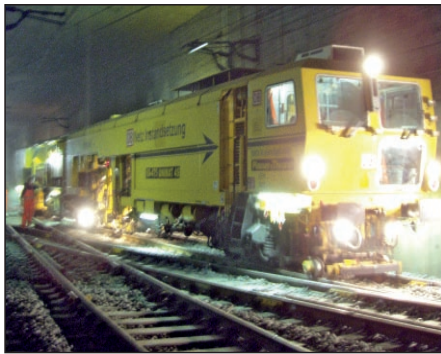
Abb. 7: Weichenstopfmaschine im Frankfurter S-Bahn Tunnel