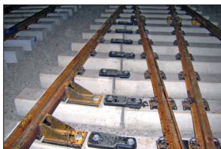
Abb. 6: Verschraubte geteilte Weichenschwellen

An bis zu vier Arbeitsorten waren bis zu 60 Mitarbeiter 19 Tage lang rund um die Uhr im Einsatz.