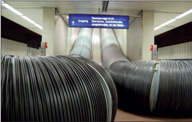
Abb. 3: Lutten auf dem S-Bahnsteig Taunusanlage